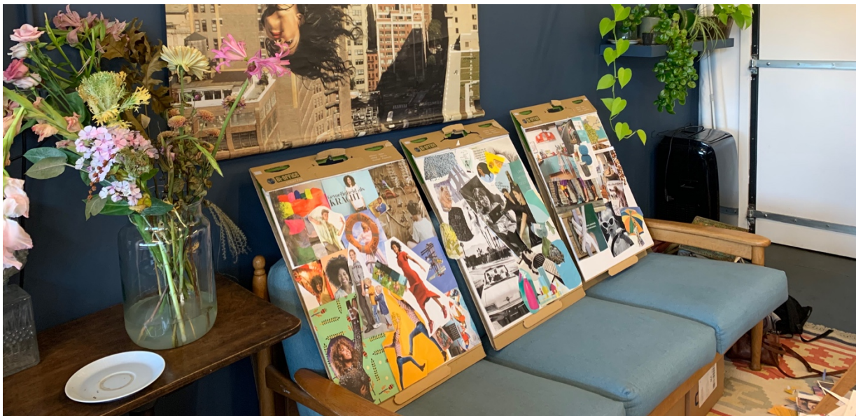
Drie moodboards voor De Pyramide